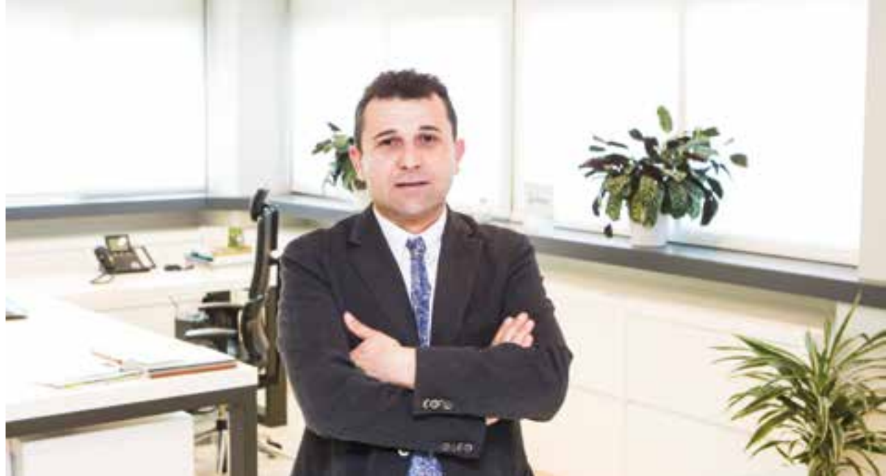
Carlos Castro Director Xeral de Delagro

Os primeiros meses do ano foron moi intensos no ámbito do cooperativismo, inmerso nun constante esforzo de adaptación a unha contorna económica fráxil e moi esixente. Nel, a integración dos procesos produtivos móstrase unha vez máis como a mellor opción para robustecer o noso tecido económico e laboral.